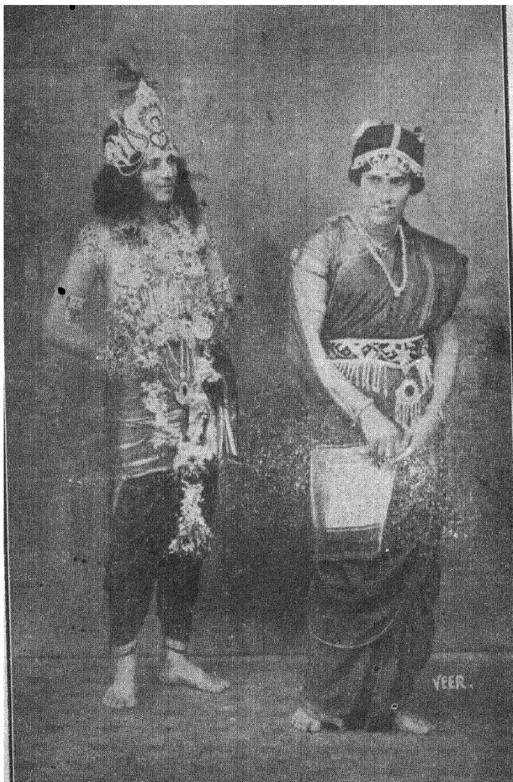
कृष्णः—भामा, तुष्टेपर्यंत ताणणं वरं नन्दे.